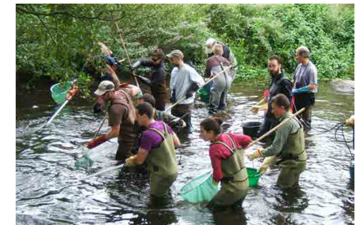
Pêche électrique d'inventaire

restauration de la biodiversité et à la continuité écologique des cours d'eau restent aussi de première importance.