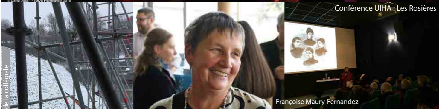
Conférence UIHA : Les Rosières