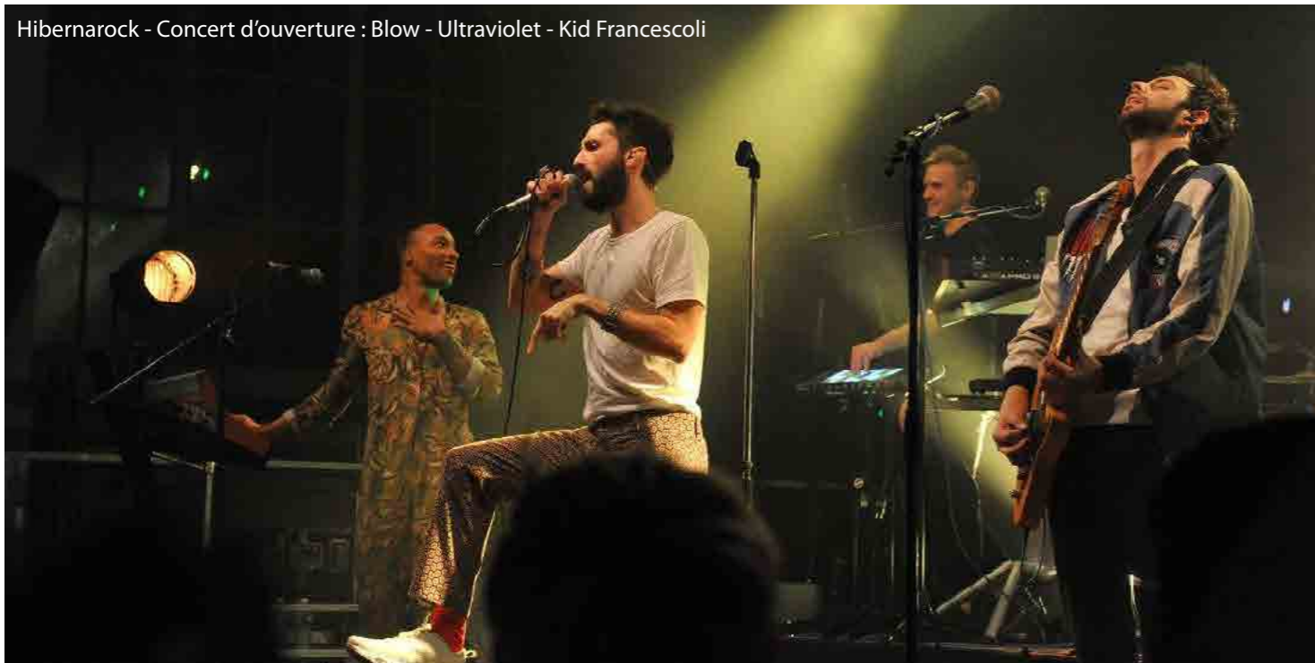
Hibernarock - Concert d'ouverture : Blow - Ultraviolet - Kid Francescoli