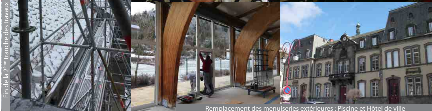
Fin de la 2 ème tranche des travaux de la collégiale