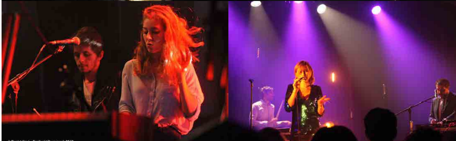
© Daniel Alma - Festival Hibernarock 2018